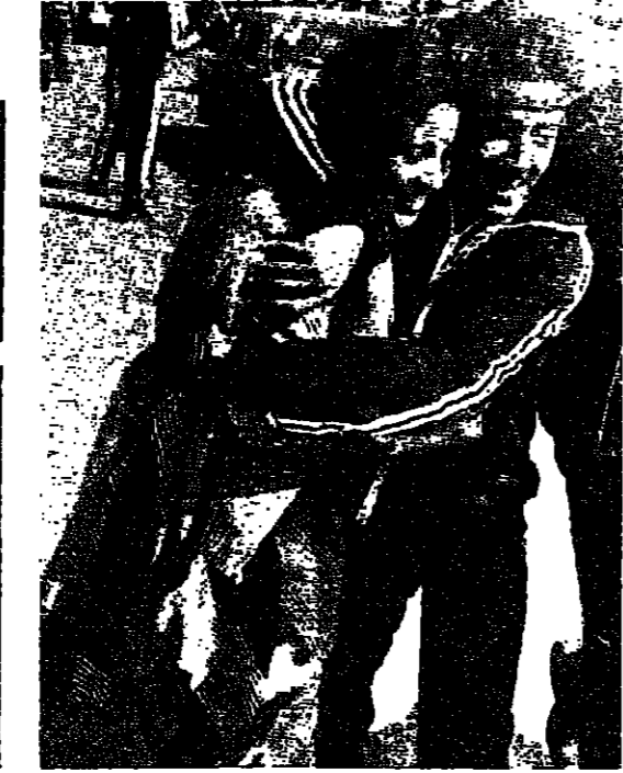
لقاء المعتقلين مع توبهم